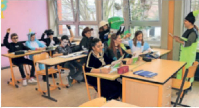
Ob als Einhorn, Dino oder Textmarker: Die Schüler der 7b am Franz-Meyers-Gymnasium gehen morgen kostümiert zur Schule.

„Wir sind eine karnevalistische Gemeinde hier in Giesenkirchen, da finde ich es schön und erstrebenswert, dass die Schüler mitmachen.“ Bedenken hat er keine. Alko-